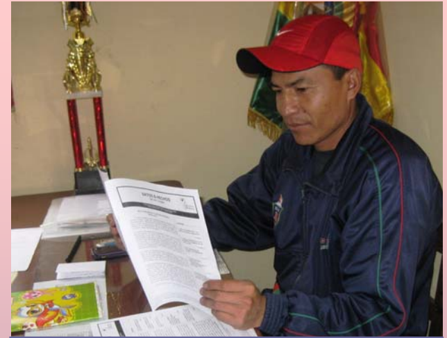
Direktor der Mittelpunktschule Yanacachi - ein Leser von „Daten & Fakten“

auf eine noch breitere soziale Grundlage stellen. So arbeiten an “Informierter Bürgerbeteiligung” nun auch die Gewerkschaft des Bergbauzentrums „Chojlla“ sowie die Elternvertretung der Mittelpunktschule von Yanacachi mit. Im Rahmen der Vereinbarungen wird unser Programm Informationskurse zum neuen bolivianischen Bildungsgesetz veranstalten und Motivations- und Orientierungsveranstaltungen zur beruflichen Bildung für Schüler der 11. und 12. Klasse anbieten, die von den Eltern als dringend notwendig erachtet wurden.