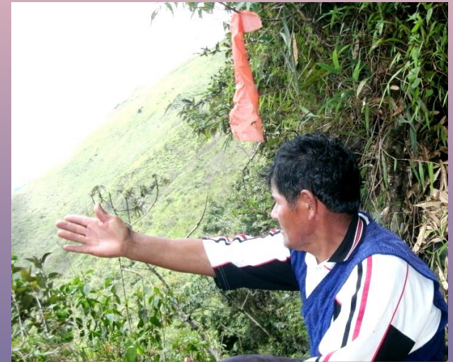
Informationsbeschaffung für „Daten & Fakten“

Fundación Pueblo The Village Foundation / Die Dorfstiftung