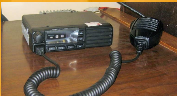
Das neue Funkgerät in Yanacachi