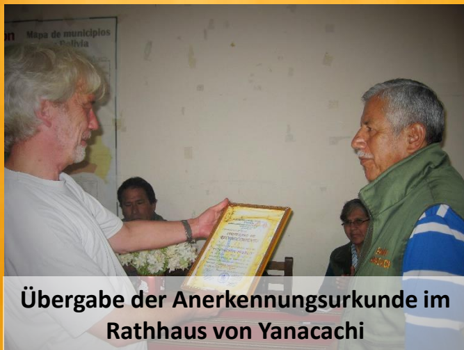
Übergabe der Anerkennungsurkunde im Rathaus von Yanacachi

www.paypal.com/cgi-bin/webscr?cmd=_sxclick&hosted_button_id=CHR297LHFM7H2