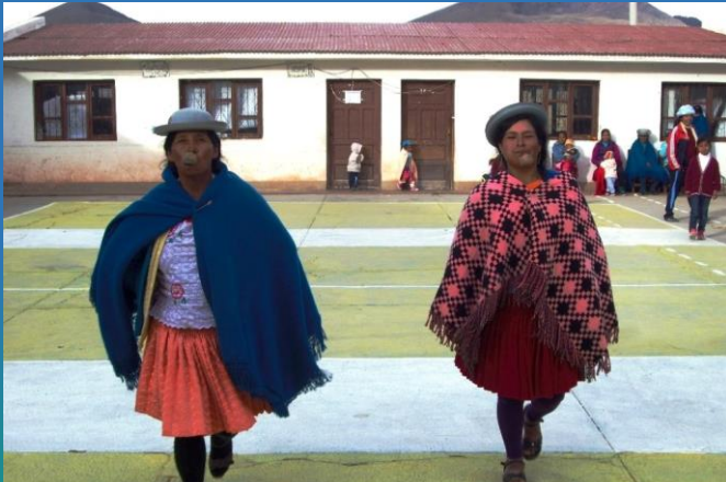
An Muttertag spielen die Großen!