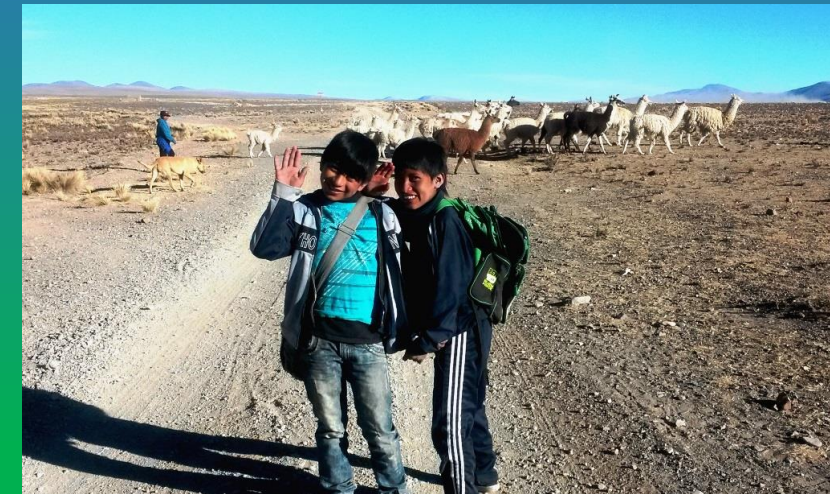
2 zukünftige Stipendiaten der Schülerpension

Im Juli startet die neue Schülerpensionen im Dorf Copacabana im Departement von Tarija.